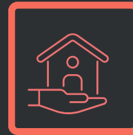
Отдельностоящие тех модули