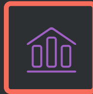
АБК, ХБК, КПП