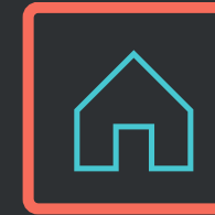
Бани, банно- прачечные комплексы